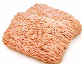
Kipworstvlees Chair a saucisse de poulet