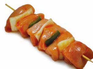
Kipbrochet gemarineerd Brochette de poulet marinee

Art. 2665: 2 x 200 g Art. 2811: 12 x 200 g