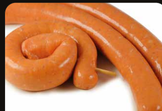
Kipmerguez Merguez de poulet

Art. 2651: 5 x 70 g Art. 2353: 20 x 100 g