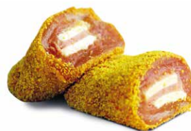
Kiporloff Orloff de poulet

Art. 2658: 2 x 200 g Art. 2363: 10 x 200 g