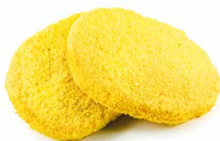
Kipburger kaas Burger de poulet fromage

Art. 2653: 2 x 110 g Art. 2355: 12 x 110 g