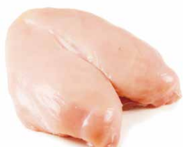
Filet kip dubbel Filet de poulet double