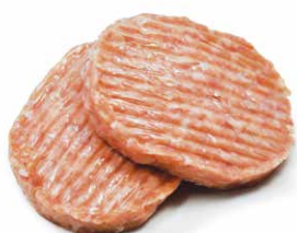
Kipburger natuur Burger de poulet nature

Art. 2653: 2 x 110 g Art. 2355: 12 x 110 g