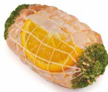
Kipgranaat Haut cuisse farcie

Art. 2657: 2 x 150 g Art. 2359: 10 x 150 g