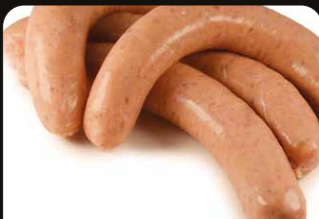
Kippenworst Saucisse de poulet

Art. 2650: 2 x 156 g Art. 2352: 16 x 156 g