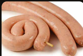
Kipchipolata Chipolata de poulet

Art. 2650: 2 x 156 g Art. 2352: 16 x 156 g