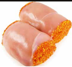
Blinde kipvink Paupiette de poulet

Art. 2657: 2 x 150 g Art. 2359: 10 x 150 g