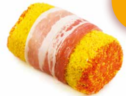
Kipboomstam Buche farcie de poulet

Art. 2661: 2 x 200 g Art. 2367: 10 x 200 g