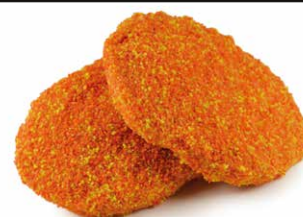
Kipburger gepaneerd Burger de poulet pane

Art. 2655: 2 x 110 g Art. 2357: 12 x 110 g